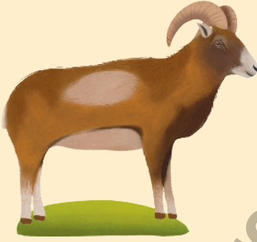
Anadolu Yaban Koyunu