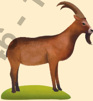
Çengel Boynuzlu Dağ Keçisi